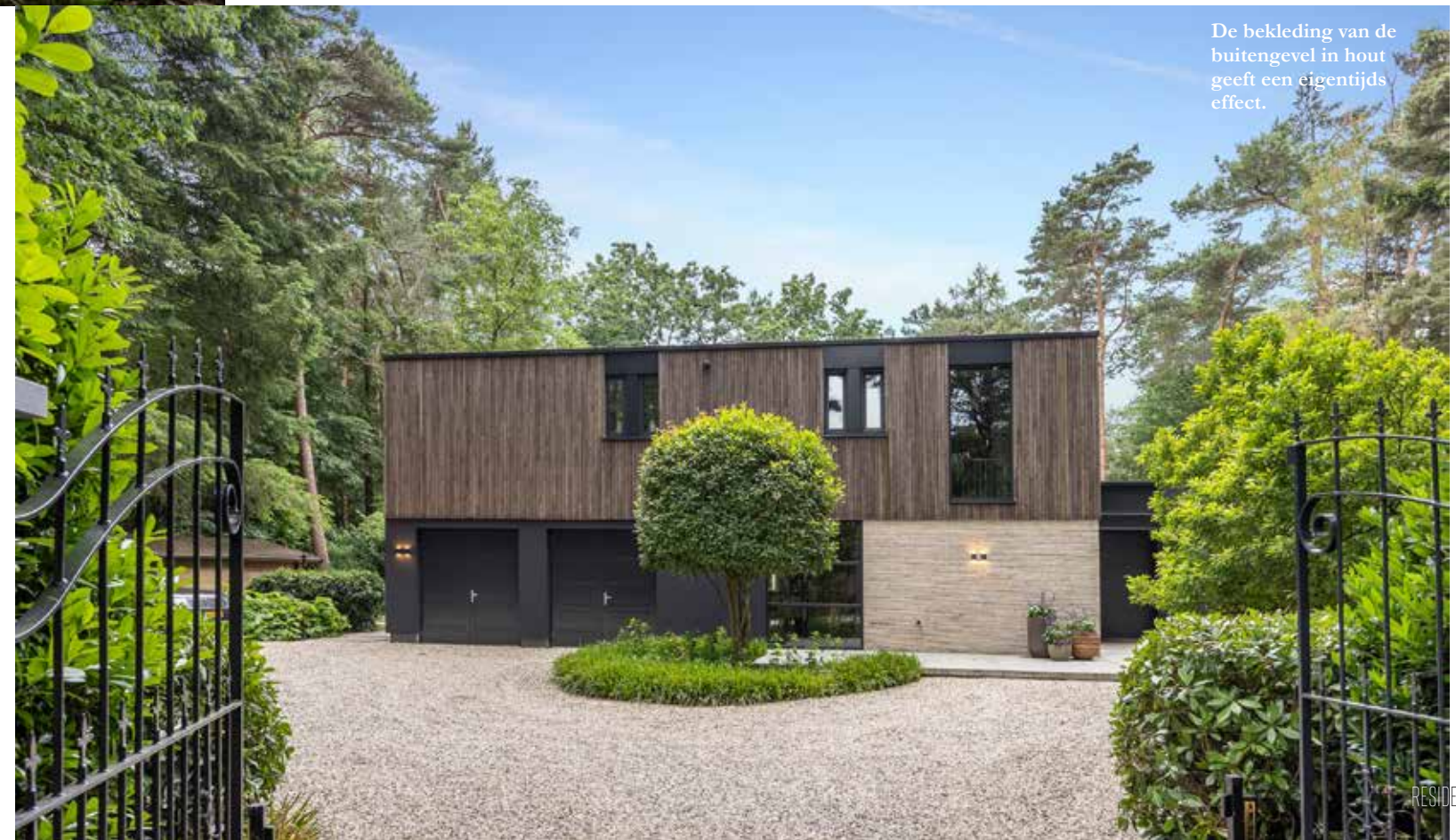
De bekleding van de buitengevel in hout geeft een eigentijds effect.