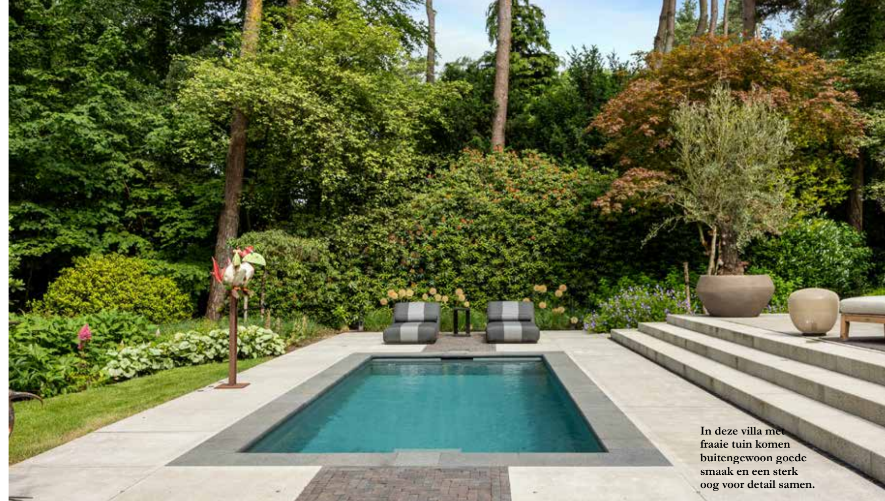
In deze villa met fraaie tuin komen buitengewoon goede smaak en een sterk oog voor detail samen.