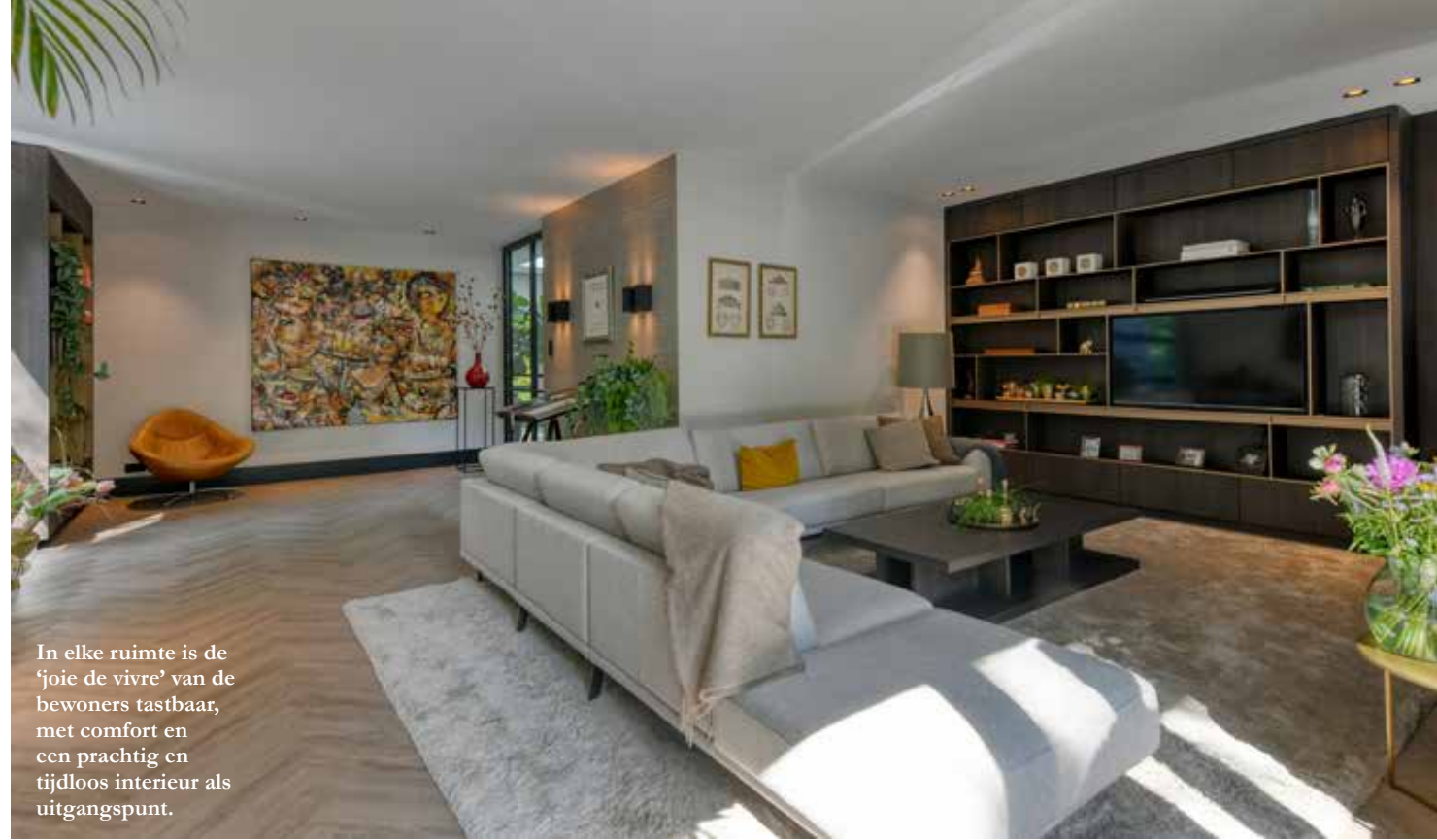
In elke ruimte is de 'joie de vivre' van de bewoners tastbaar, met comfort en een prachtig en tijdloos interieur als uitgangspunt.