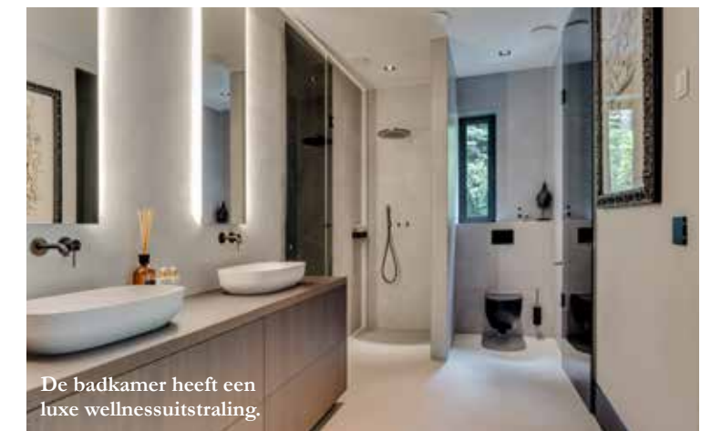
De badkamer heeft een luxe wellnessuitstraling.

In elke ruimte is de 'joie de vivre' van de bewoners tastbaar, met comfort en een prachtig en tijdloos interieur als resultaat.