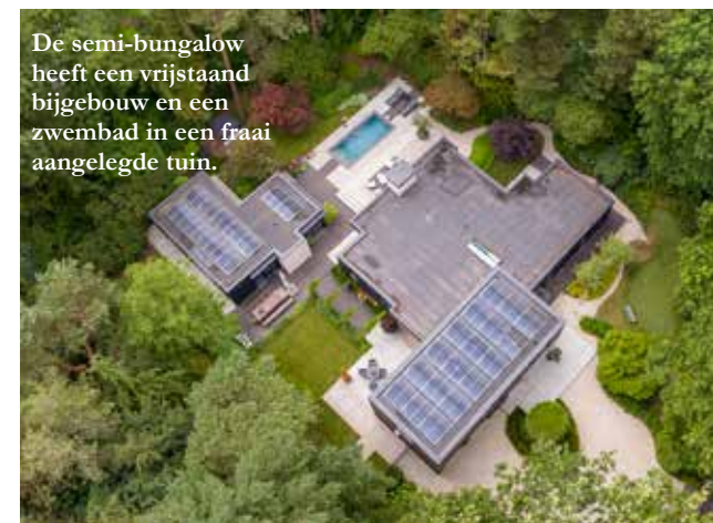
De semi-bungalow heeft een vrijstaand bijgebouw en een zwembad in een fraai aangelegde tuin.

De tuin rondom de villa is onder architectuur volledig nieuw aangelegd met een zwembad van 6 x 3 meter, verschillende heerlijke terrassen, volwassen bomen, gazons met borders en beregening uit op afstand in te schakelen eigen bron. Achter de villa is een vrijstaand bijgebouw gerealiseerd dat in alle opzichten de hoofdwooning aanvult. Het is een gewel-